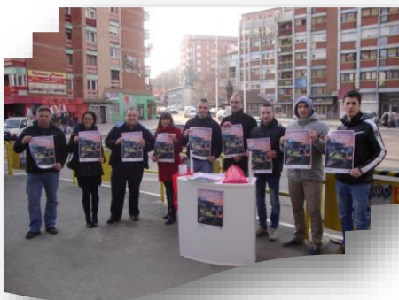
Aktivistët në veri të Mitrovicës shpërndajnë fletushka dhe posterë për iniciativën e sigurisë së studentëve

Ky udhëzues është bazuar në përvojat e Qendrës avokuese për kulturën demokratike (ACDC) si pjesë e Kampanjës “Drejtësia dhe njerëzit” në organizimin e iniciativave avokuese në katër komunat në Kosovë – Leposaviq, Mitrovicë, Zubin Potok, dhe Zveçan. Është menduar si një mjet për çdo qytetar në Kosovë që të përdor si një bazë për organizimin e iniciativave në çështjet lokale. Rekomandimet dhe hapat e dhënë këtu paraqesin rezultatet e suksesshme në gjashtë kampanjat lokale avokuese dhe nuk mbulojnë strategjitë për avokim për institucionet qendrore, edhe pse shumë nga këta hapa do të ishin të ngjajshëm.