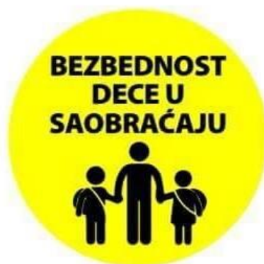
Logo e iniciativës qytetare "Siguria në trafik për fëmijët" në Zveçan

Mediat mund të jenë aleatë të juaj kur implementoni aktivitete, posaqërisht nëse ka media të cilat veçse kanë adresuar çështjen e njëjtë. Gjatë dërgimit të ftesave për ngjarjet e juaja, përdorni çdo mundësi për paraqitje të mysafirëve në radio/TV emisione në mënyrë që të promovoni iniciativën e juaj dhe shpjegoni tek masa e gjerë se pse iniciativa e juaj është e rëndësishme dhe se si mund të tjerët ta ndihmojnë. Ky lloj ii çasjes në media poashtu ka për qëllim të demonstrojë tek vendim-marrësit lokal se grupi i juaj është serioz rreth iniciativës suaj. Lloje të tjera të ngritjes së vetëdijes sikurse panot, posterët dhe fletushkat mund të jenë një mënyrë e mirë për të promovuar aktivitete të caktuara apo të përfshijë më shumë njerëz nëaktivitetin e juaj në përgjithësi.