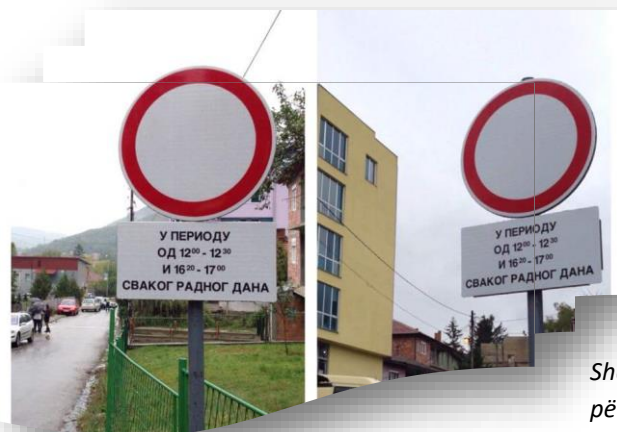
Shenjat e trafikut në Zveçan të vendosura nga Zyra lokale për planifikim urban si përgjigje e kampanjës avokuese të qytetarëve