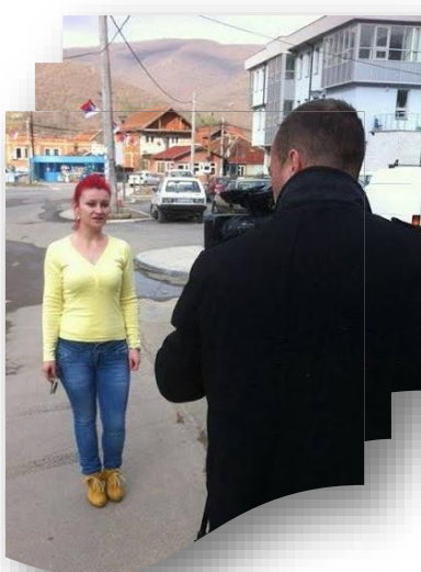
Iniciativa qytetare në Zubin Potok filmon një video për sigurinë në trafik që të ju rikujtoj zyrtarëve për premtimet e tyre për të vendosur pengesat në rrugën kryesore

Në shumë raste, zyrtarët do të thonë “kjo nuk mund të bëhet tani, por kur të diskutojmë buxhetin e ardhshëm do të përfshijmë këtë propozim”. Nëse institucionet thonë sedo të planifikojnë të përfshijnë iniciativën më vonë në buxhetin e ardhshëm, merni një informacion të qartë se kur do të krijohet ky buxhet/apo kur do të votohet. Në ndërkohë kini parasysh që t'i rikujtoni zyrtarit tuaj për premtimin e bërë sa i përket buxhetit.