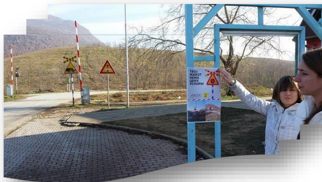
Qytetarët në Zveçan vendosin posterë afër kalimit hekurudhor që të ngrisin vetëdijen për portat e dëmtuara