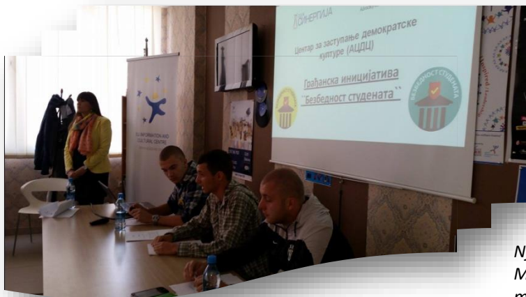
Një iniciativë qytetare në veri të Mitrovicës gjatë një konference për shtyp me gazetarë

Pas çdo aktiviteti, rishikoni planin e veprimit dhe përcaktoni nëse ndonjë ndryshim është i nevojshëm duke u bazuar në reagimet nga publiku dhe zyrtarët. Poashtu mund të jetë e dobishme që të caktohet një kohë e rregullt për të plotësuar planin e veprimit (një apo dy herë në muaj) nëse iniciativa është e fokusuar në shtrirje të informatës se sa në ngjarje të mëdha. Në mënyrë që grupi të jetë i koordinuar, përpiloni planin e komunikimit që të jeni në kontakt. Jini të sigurt se atje ka një plan të qartë se kush është përgjegjës për të rifreskuar grupin me informacione të reja, dhe të mos jenë vetëm premtime në ajër se do të mbesim në kontakt. Grupet në Facebook dhe Viber mund të jenë më efektivet, por është me rëndësi që të pyetet grupi se çfarë është më e përshatshme për ta.